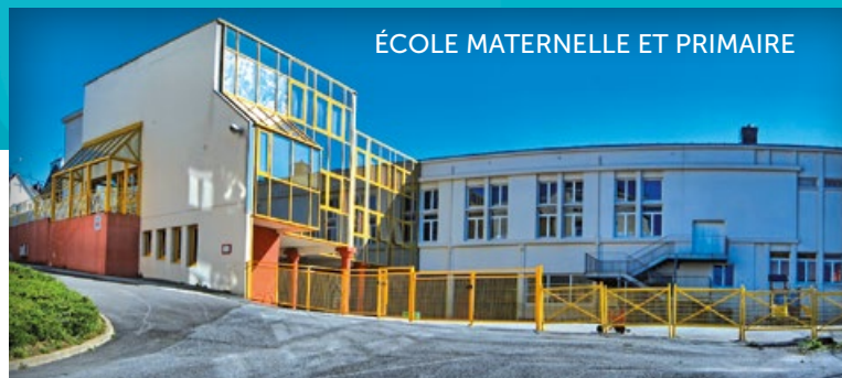
ÉCOLE MATERNELLE ET PRIMAIRE